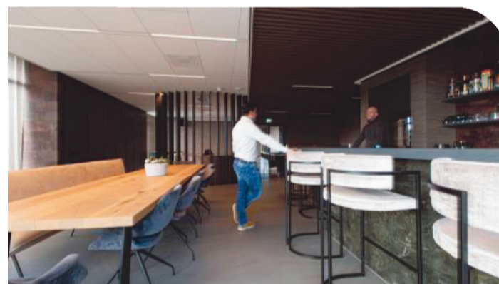
Foto's: Locatie Pijnacker volledige realisatie voor eigenaar en huurder door Maakt Projecten.

Klaar om samen met ons een werkplek te realiseren die de verwachtingen overtreft?